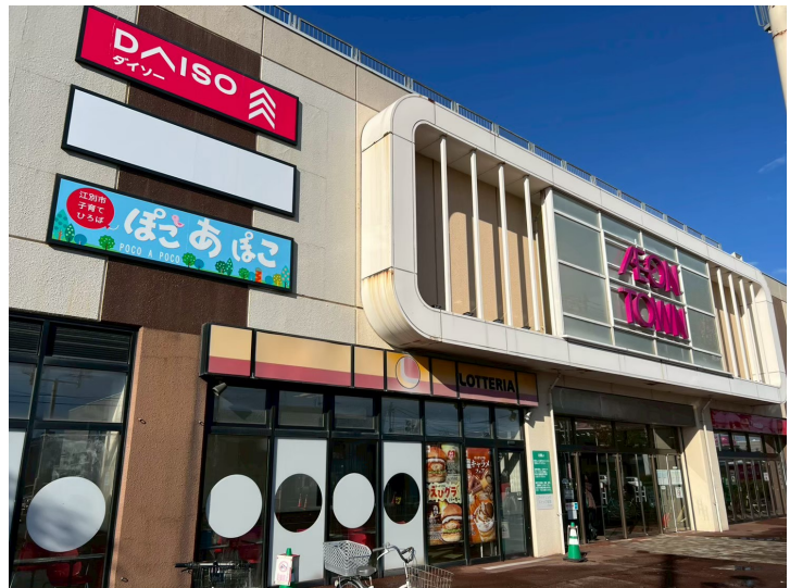
イオンタウン江別の子育てひろば「ぼこ あぼこ」の看板

2階空き店舗スペースを活用した、市直営の子育て支援センターである。コンセプトは「楽しむ・あんしん・げんき」をテーマに、0歳から小学6年生までを対象とする。施設構成は約620平方メートルの空間に、大型複合遊具、赤ちゃんコーナー、授乳室、相談室、託児ルームを完備。名前の由来は市民公募により決定。イタリア語の音楽用語で「ゆっくり、ゆったり、少しずつ」を意味し、その子らしく育める場所への願いが込められている。本視察では、商業施設内への設置による利便性の向上、官民連携による経済波及効果、および持続可能な運営体制（財源確保策）について重点的に調査を行った。