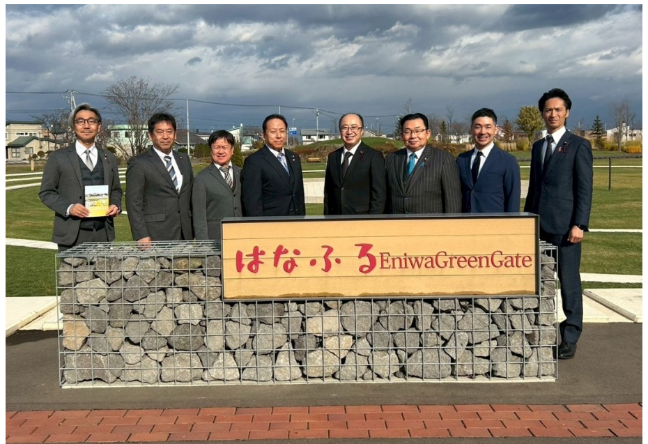
花の拠点「はなふる」にて

人口約7万人(2026年)で、市域面積294.65平方キロメートルの恵庭市は、札幌市と新千歳空港のほぼ中間に位置し、恵まれた交通アクセスと穏やかな気候風土を持つまちで、早くから住宅地整備を進めると共に、公共下水道や大学・専門学校、工業団地などの都市基盤の整備が進められ着実に人口が増えている。また、支笏洞爺国立公園を後背地とした恵庭溪谷は「白扇の滝」や「ラルマナイの滝」などが点在し、市の観光スポットとして、また、最近では市民主導による花のまちづくりが盛んで「ガーデニングのまち」として全国的に知られるようになった。将来都市像を「花・水・緑 人がつながり 夢ふくらむまち えにわ」とし、「時代に沿った地域運営」、「暮らしの安全安心」、「次世代へつなぐ自然環境」、「人と人とのつながり」、「情報発信・魅力PR」の5つの「まちづくりの視点」を明らかにして施策を推進している。