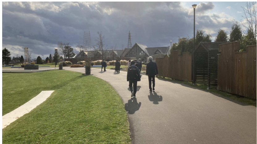
花の拠点となる「はなふる」の敷地内

気軽に花と緑に触れられる公共空間として整備計画が始まり、道の駅隣接地に拠点施設「はなふる」を整備した戦略的事業である。Park-PFI 制度を活用し、スターバックスやマリオットホテルなど民間事業者を呼び込みつつ、収益を公園整備に還元する仕組みは財政負担を抑えながら質の高い公共空間を創出する成功例であるように感じた。