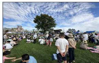
YEGフェスティバル ~えにふえす~

ってみたい」をかなえる新しい恵庭の遊び場・えにわファミリーガーデン「りりあ」などの施設も大きな魅力になっていると感じた。西尾市においても、一色さかな広場などにキャンピングカーなど車中泊を希望する人が安心して泊まれる施設として、RVパーク整備の可能性も提言したい。