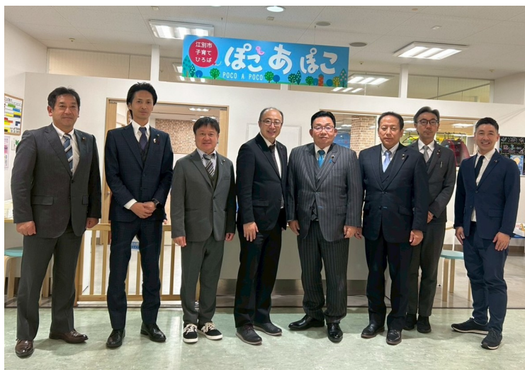
イオンタウン江別2階にある子育てひろば「ぽこ あ ぽこ」

人口約11万7600人(2026年)で、市域面積187.38平方キロメートルの江別市は、北海道の中央部に位置し、道都・札幌市に隣接する都市である。古くから「れんがのまち」として知られ、窯業や農業が盛んであるとともに、市内に複数の大学を擁する文教都市としての側面も持つ。近年は札幌のベッドタウンとして発展してきたが、全国的な例に漏れず人口減少・少子