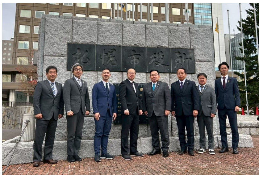
札幌市役所前にて

全体として、札幌市は「職員の安全確保」と「市民への丁寧な対応」の両立を掲げ、段階的・組織的にカスハラ対策を進める先進的な自治体である。