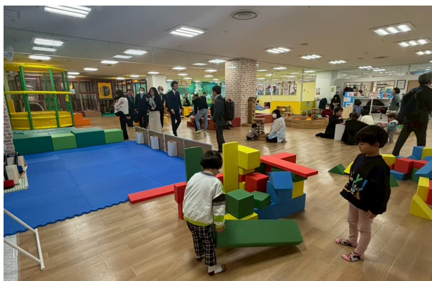
イオンタウン江別2階の子育てひろば「ぽこ あ ぽこ」の様子

という相乗効果に大きな可能性を感じた。西尾市においても、既存の商業施設と連携した子育て支援拠点の整備や、広告収入を活用した財源確保など応用可能性が高い。今後の子育て環