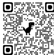
西尾市職員採用サイト

西尾市公式ホームページ内「正規職員採用試験」のサイトの「西尾市職員採用サイト（パブリックコネクト）」にアクセスしてください。