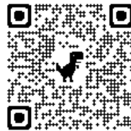
西尾市職員採用サイト

西尾市公式ホームページ内「正規職員採用試験」のサイトの「西尾市職員採用サイト（パブリックコネクト）」にアクセスしてください。