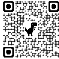
西尾市職員採用サイト

西尾市公式ホームページ内「正規職員採用試験」のサイトの「西尾市職員採用サイト（パブリックコネクト）」にアクセスしてください。