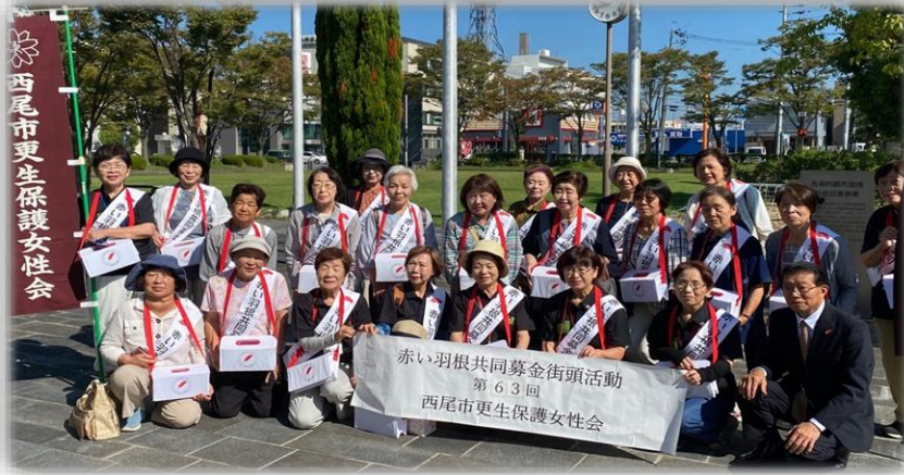
第63回赤い羽根共同募金街頭活動(三和・ハツ面地区の皆さん) 令和6年10月1日(火)～10月3日(木)