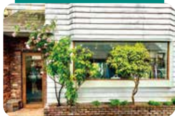
two knows store