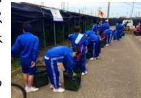
学校茶摘み体験の様子

抹茶生産に特化した覆下栽培にみる茶畑景観とともに、紅樹院の「茶祖奉告祭」、70年以上の歴史のある「学校茶摘み体験」を通して広く市民に親しまれており、歴史的風致のひとつになっている。