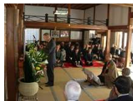
吉良義央公毎歳忌

吉良義央を顕彰する毎歳忌が90年間にわたり毎年開催され、また吉良氏ゆかりの寺院で開催される「西野町のお釈迦さん」「矢田のおかげん」は、地域の伝統行事として定着し、吉良氏ゆかりの建造物と人々の活動が一体となった吉良荘の歴史的風致を形成している。