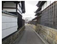
崇寛寺と唯法寺の間の路地

西尾城下町をもとに発展した市街地では、城下町時代の町割りや道路、社寺等の歴史的建造物が多く残されている。