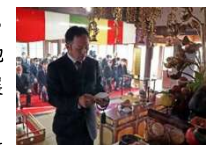
紅樹院で開催される茶祖奉告祭

本市を代表する特産品である抹茶は、西尾の製茶業発祥の地である稲荷山茶園を中心に発展した。