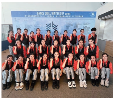
曲やダンスの雰囲気に合わせて、自分たちで考えた衣装で全国大会に挑んだ