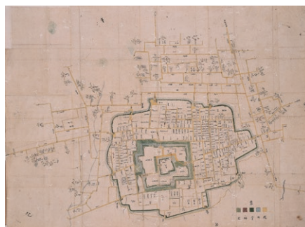
出羽国山形城図 (市教育委員会蔵)