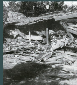
昭和20年の三河地震で倒壊した家屋（丁田町）

の揺れに見舞われ、約1万5000棟の建物が全壊すると想定されています。古い建物、特に昭和56（1981）年以前に建てられた木造住宅は現在の耐震基準を満たしておらず、強い揺れで倒壊する可能性があります。尊い命を守るためにも、耐震診断を受け、必要であれば耐震工事をしてください。