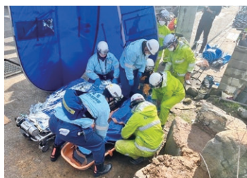
能登半島地震の被災地での活動の様子

市消防本部では、東日本大震災や御嶽山の噴火災害、静岡県熱海市の土砂災害などが起こった際に緊急消防援助隊を派遣してきました。令和6年能登半島地震でも、石川県輪島市と珠洲市に救急隊、後方支援隊を派遣しています。