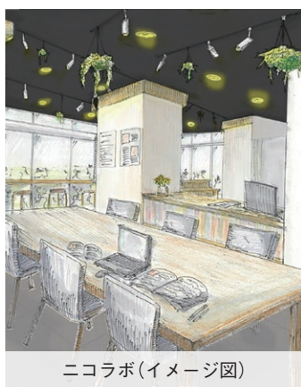
ニコラボ(イメージ図)

まちの中心である西尾駅周辺エリアで商業活動や市民活動が活発になれば、その波は多方面に広がり、市内全域が活気づくると考えています。ニコラボでは、中心市街地で活動する方や企業を支援。「まちのために何かやりたい」という思いを具現化します。より多くの方がまちづくり活動に興味を持てる、参加したいと思えるような仕組みを作り、中心市街