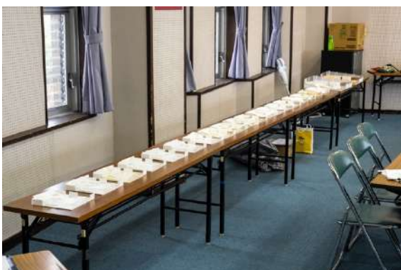
多世代交流広場の検討模型(1/100)