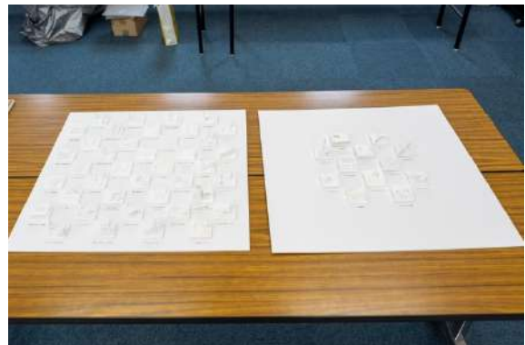
アクティビティのスタディ模型