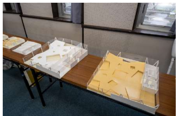
多世代交流広場の検討模型(1/50)