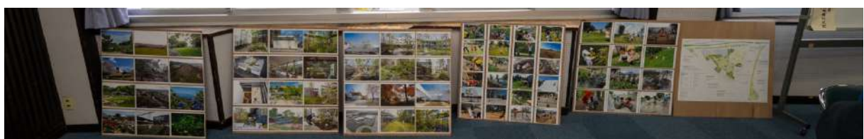
ランドスケープの展示パネル