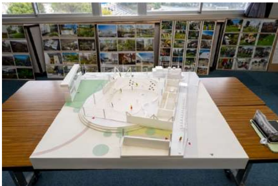
多世代交流広場模型(1/50)