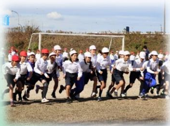
体を鍛える マラソン大会