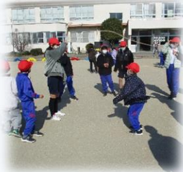
上級生と一緒に なわとび