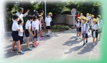
自主的な あいさつ運動