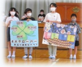
学級目標を核とした 学級文化づくり