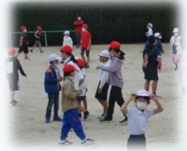
通学班ごとに遊ぶ きららタイム