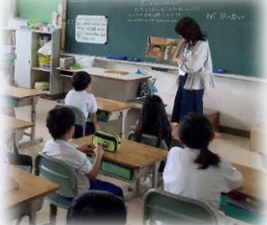
図書ポラさんによる 読み聞かせ