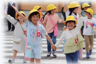
交通指導員・PTAボ ランティアに見守ら れた交通安全教室