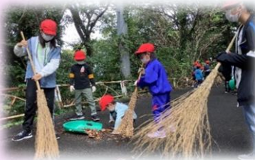
ハツ面山をきれいにする しあわせ運動