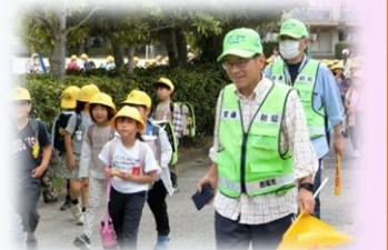
ボランティアパトロー ルの皆さんに見守られ ながらの下校

世の中の動きが加速し、子どもたちには、さまざまな新しい能力、そしてたくましく生きぬく力が求められています。その一方で、これまで、あるいはこれからも変わらずに大切に育むべき教育内容があります。