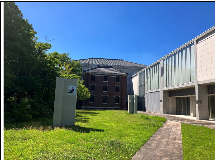
写真1 岩瀬文庫書庫東側の状況 (東から)