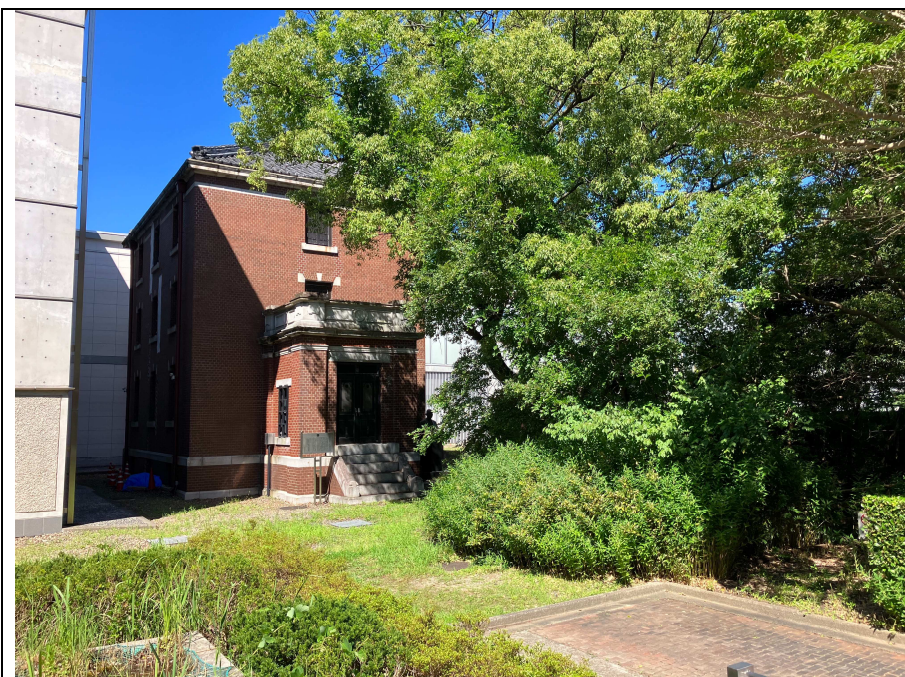
写真2 岩瀬文庫書庫南側の状況 (南から)