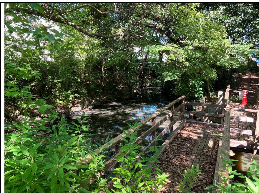
写真6 庭園の池の状況（西から）