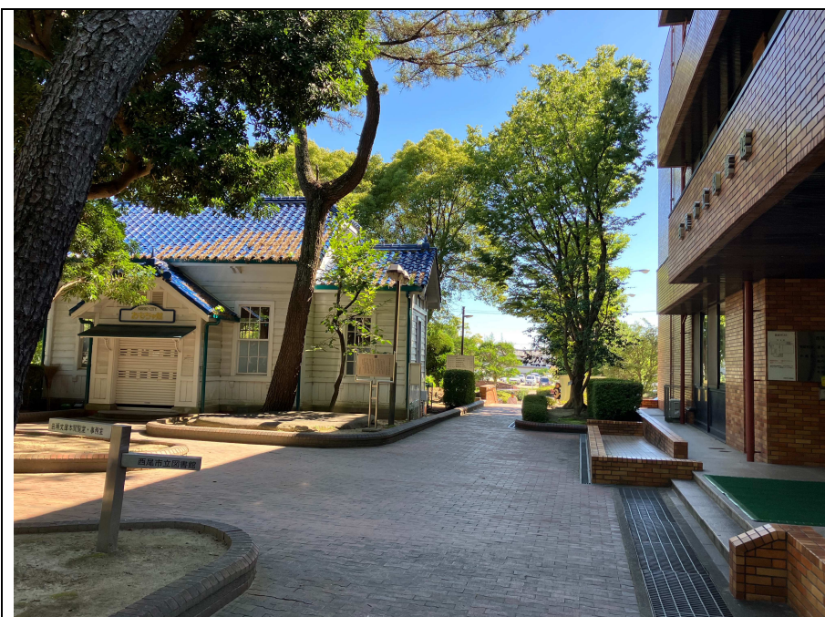
写真3 図書館おもちゃ館北側の 状況(北から)