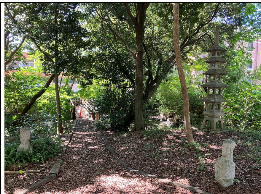
写真5 庭園の状況（東から）