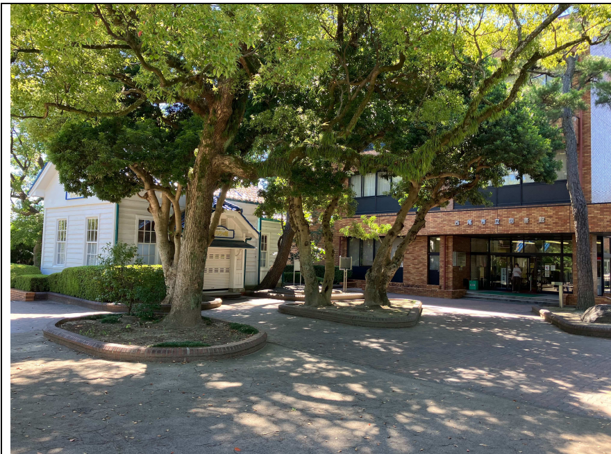
写真4 図書館おもちゃ館と図書館前の状況（北東から）