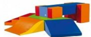
⑥ クッションブロック