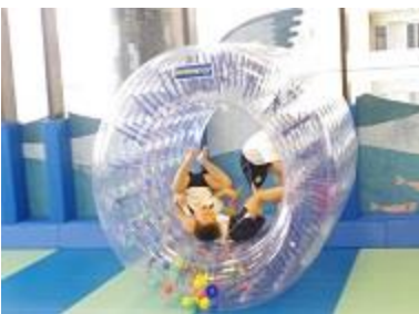
⑦ サイバーホイール