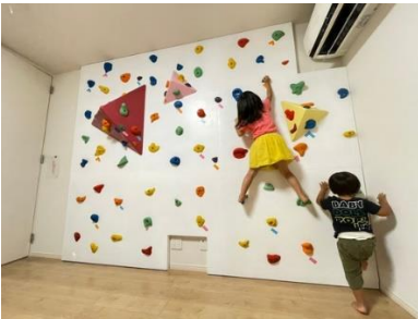
① クライミングウォール