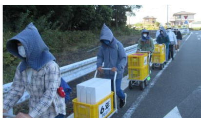
2校1園合同第1次避難訓練

前期防災集会では、防災活動のめあてを決め、後期防災集会では、活動のまとめを各学年が発表し次年度へつなげます。こうして先輩から後輩へ防災の学びは引き継がれています。