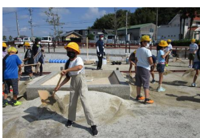
4年 饗庭塩の里・1/2成人式