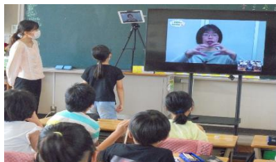
地震のメカニズム学習

5年生は「豊田工業高等専門学校出前講座」の中で、講師さんから身近なペットボトルを使って、液状化現象の原理を学びました。こうした学びは、総合的な学習で行う「防災マップづくり」につながっていきます。