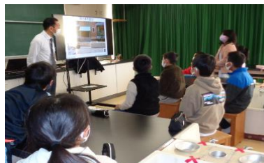
地盤の液状化現象の学習