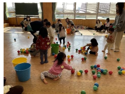
【にこにこルームの様子】