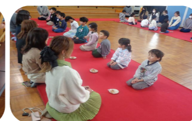
保護者を招いて「卒園茶会」