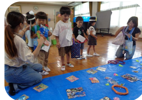
「夏祭り」PTA(双葉)会と協力!