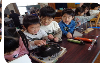
不思議がいっぱい「科学で遊ぼう」