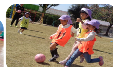
講師による「サッカー教室」