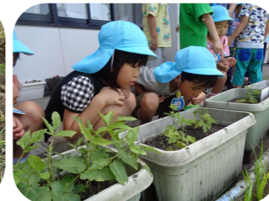
ゴーヤのにおい、どんなかな?