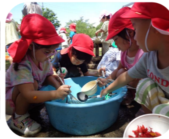
花びらを使って「色水遊び」