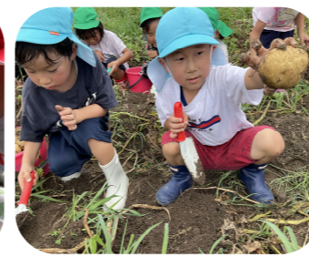
じゃがいもでカレー作り!