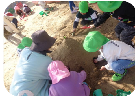
「砂遊び」みんなで協力、山づくり