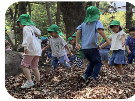
八幡さんにも自然がたっくさん。