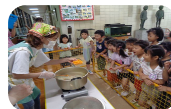
みんなで「カレークッキング」

*子どもの遊びや生活は、「10の姿」の項目で区切られるわけではなく、相互に関連しあって展開されます。