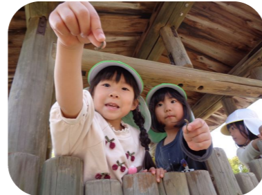
自然がいっぱい。みつけた!