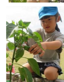
夏野菜の栽培・収穫

夏野菜を植え、毎日お世話をします。自分たちで育てた野菜には愛着がわき、苦手でも食べてみようという気持ちが生まれます。