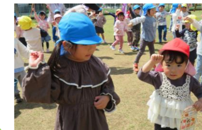
異年齢交流 年上児が優しく接してくれます。

日々の生活の中で年上児が年下児に優しく接しています。優しく接してもらった嬉しい気持ち、人への優しさになります。