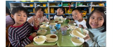
みんなで食べるおいしい給食

夏野菜を植え、毎日お世話をします。自分たちで育てた野菜には愛着がわき、苦手でも食べてみようという気持ちが生まれます。