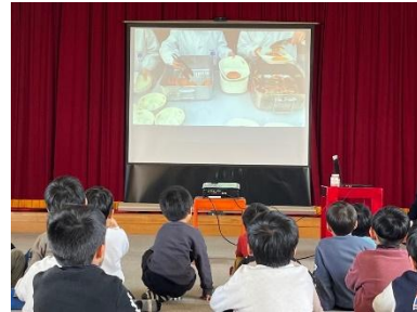
学校栄養士による出前授業