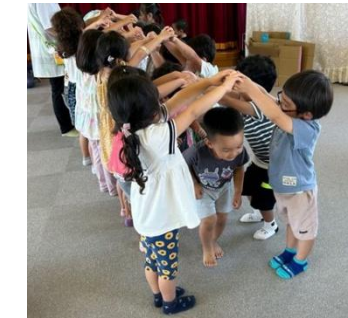
異年齢児との交流遊び