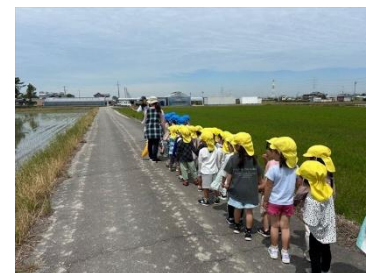
交通安全指導(散歩)