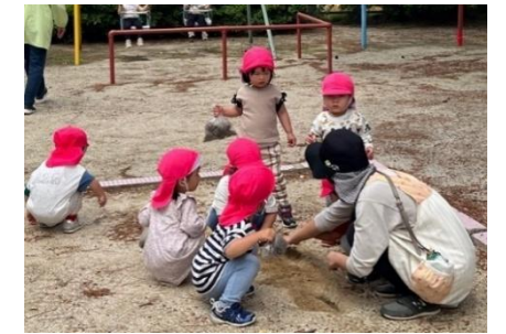
保育士や友達との遊び