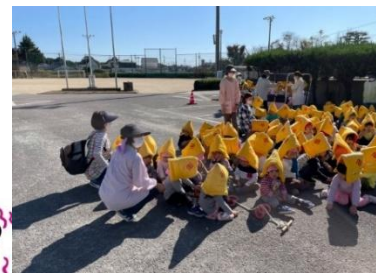
地震の訓練(小学校への避難)