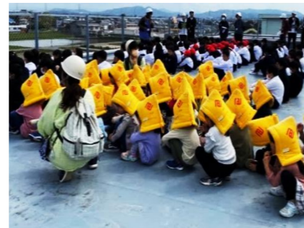
小学校と合同避難訓練

災害の時の被害を最小限にするために、地域、小学校と連携を取りながら、子ども達と一緒に安全について考え、訓練を行っています。