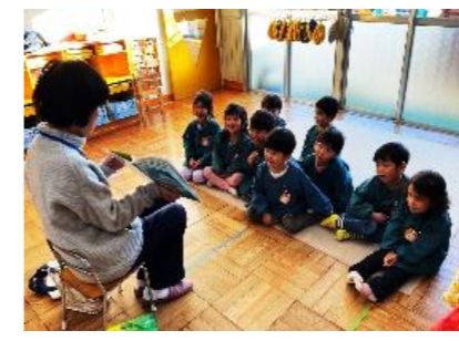
読み聞かせボランティア