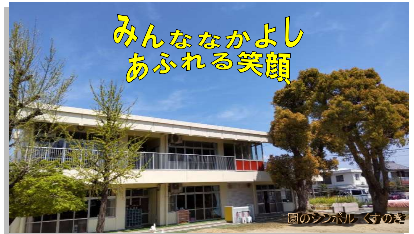
園のシンボル くすのき