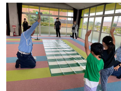
信号を見て横断歩道の渡り方を覚えます。