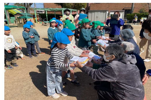
デイサービスの方との交流 利用者さんが卒園をお祝いしてくれました。