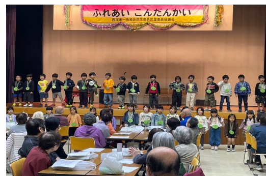
ふれあい懇談会 1人暮らしの方と歌やふれあい遊びをして交流しました。

異年齢の関わりや地域の人との触れ合いを通して、優しさや思いやりの気持ちの育ちを大切にしながら、保育をすすめています。