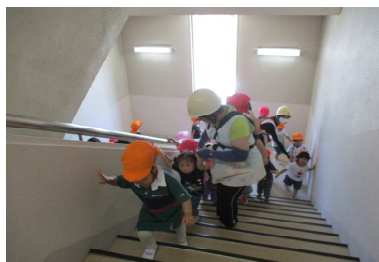
津波を想定した公民館合同避難訓練で屋上まであがります。