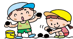
季節に合わせた 遊びを楽しみます