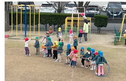
お兄さんお姉さんと 一緒に遊ぶと楽しいね