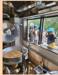
給食室見学 今日の給食何かな？