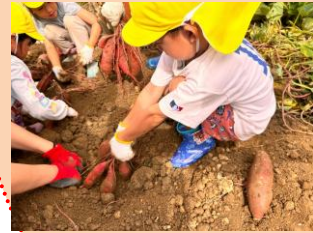
芋掘りうんとこしょ！ おいもがたくさんつながって 重たいよー！