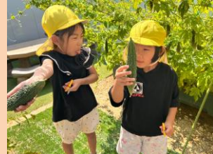
ゴーヤの収穫 匂いも苦いんだ！