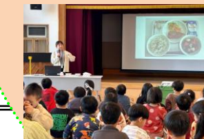
小学校教諭による出前授業