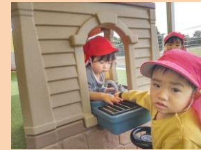
ともだちと一緒に 遊ぶの楽しいな！