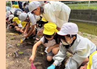
綿の苗植え 福南小5年生との交流