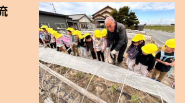
地域の方の畑ですいかの苗に名札を つけます。大きくな～れ！