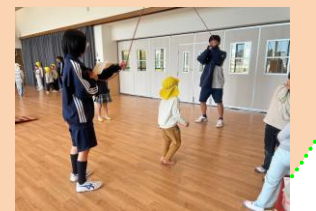
福地中学生 保育体験

福地地区に伝わる「わた」作りについて福地南部小学校生との交流を深めたり、小学校教諭と連携を図ったりし、保育園と小学校が切れ目ない子どもへの支援ができるようにしています。また、福地中学校生との交流をし、様々な人と関わる楽しさが実感できるようにしています。