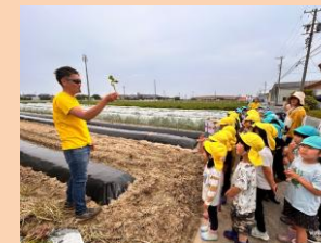
「野菜の先生」からさつまいもの苗差しを 教えてもらいます。