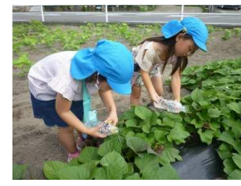
さつまいも畑で水やり