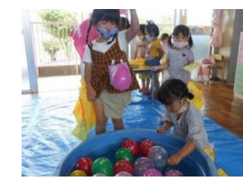
夏まつりでヨーヨー風船つり