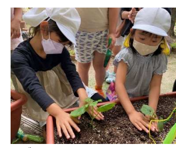
ゴーヤ、大きくなあれ