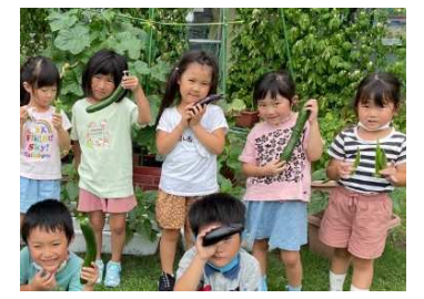
夏野菜ができたよ!