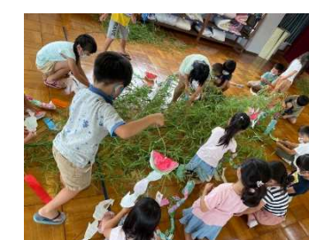
願いが、かないますように