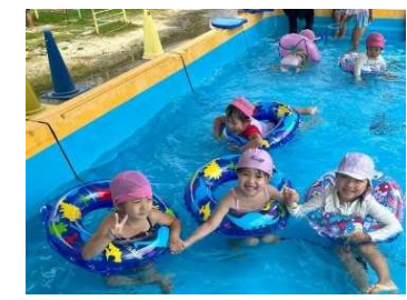
プール、きもちいい〜