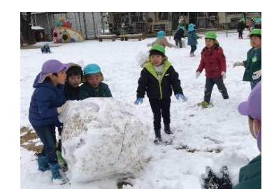
ゆきだるま作ろう