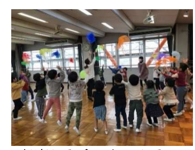
お楽しみ会、たのしみ〜