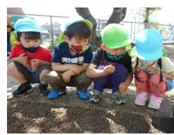
だんご虫いるかなあ