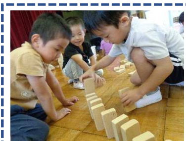
「どうやったら倒れないかな？」みんなで考えた工夫したりします。