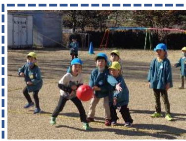
友達と仲良く協力しあってドッチボール！作戦を練って何度も挑みます。