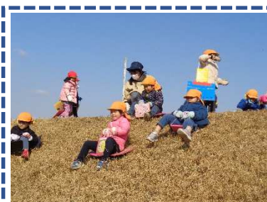
冬には恒例の土手すべりをして、いきいきと遊びます。「それー！」