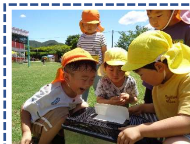
園庭には、季節の動植物がいっぱいいます。生き物は優しく扱います。