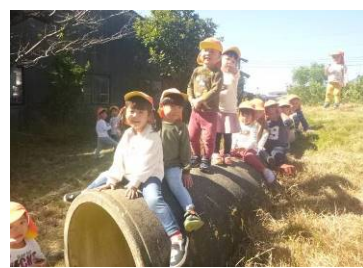
♡ みんな一緒 ♡