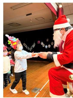
♡ クリスマス会 ♡