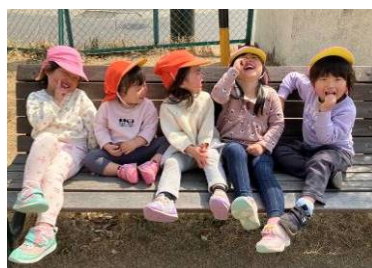
♡ お姉ちゃんと一緒に ♡

「人とつながるって楽しい」と感じる保育を目指し、温かなやり取りや触れ合いを大切にします