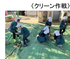
＜クリーン作戦＞ 保育園が綺麗になるように、みんなで草取りや落ち葉拾いをしています。