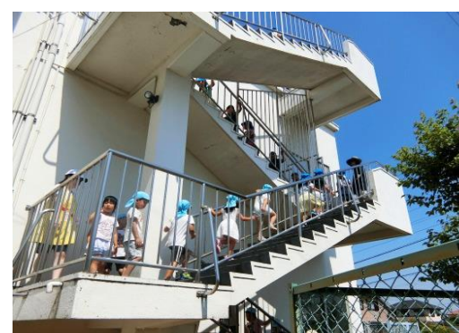
津波の訓練(様々な被害を想定した訓練)