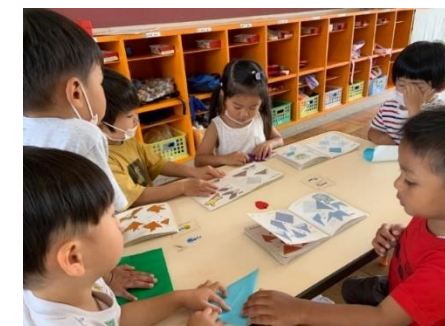
室内遊び(折り紙遊び)