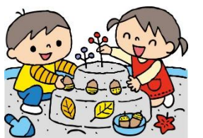
工夫したり協力したりしながら遊びます