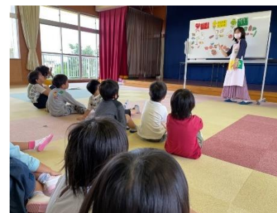
栄養士による栄養教室