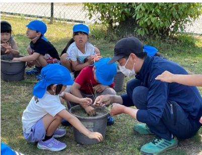
講師を招いてバケツ稲作り