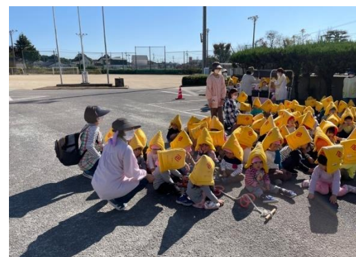
地震の訓練(小学校への避難)