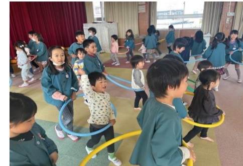
異年齢児との交流遊び