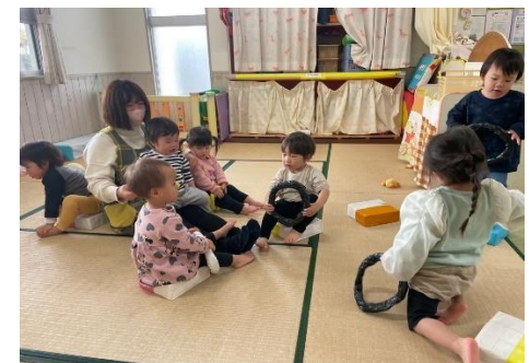
保育士や友達との遊び