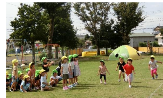
芝生の園庭で走って遊ぼう