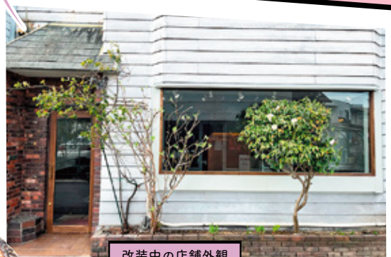
改装中の店舗外観