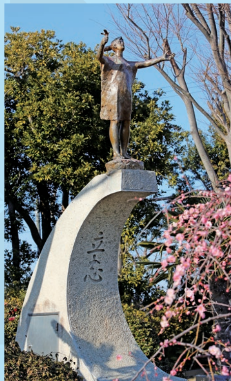
大空へ—立志— 一色中学校

現在は、日本藝術院会員、公益社団法人日展理事、名古屋市立大学名誉教授、(一社)西尾市文化協会顧問、西尾市名誉市民。