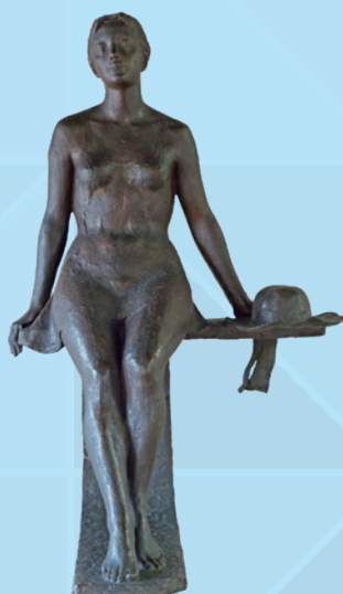
風韻 西尾市立図書館