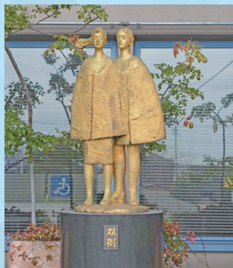
双樹 一色町公民館