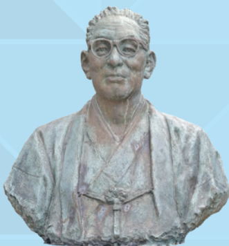
尾崎士郎 尾崎士郎記念館