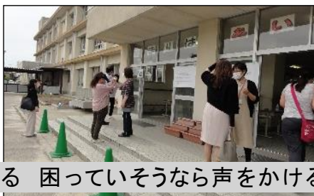
保護者全員に検温(引き取り訓練)