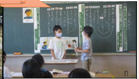
考えの伝え合い(6年道徳)