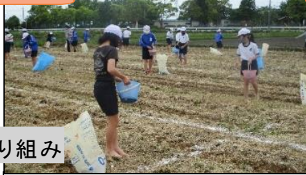
肥料まき(5年稲作学習)