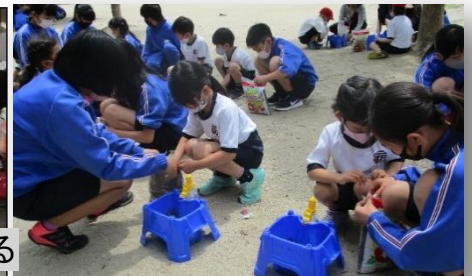
アサガオの種まき(1年と6年)