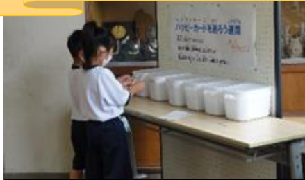
ハッピーカードを送ろう週間