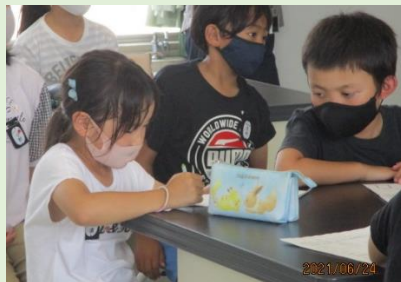
関わりの中で友達の長所を知る