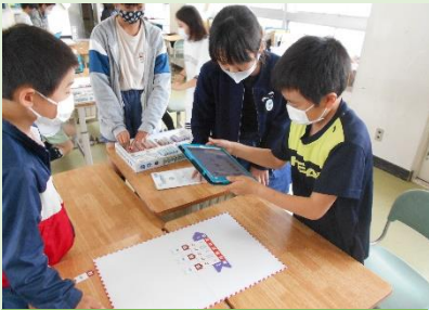
タブレットの活用