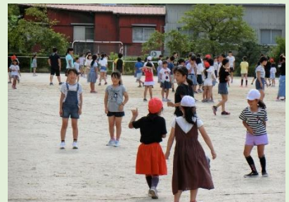
「きららタイム」通学班で遊ぶ