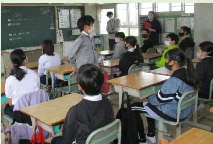
思いを伝える「やつトーク」