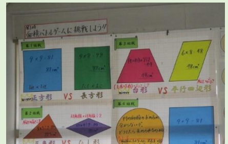
学びの過程を大切に