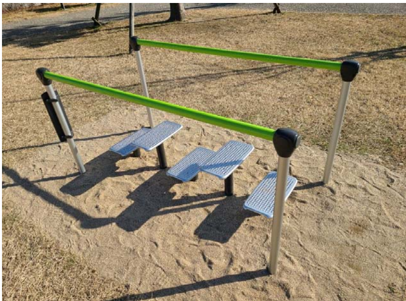
01-9_一色地域文化広場 備考: 健康遊具設置 ③ステップ

手すりを両手でつかみ ながら足首やひざが 大きく曲がるように 意識してステップを 漕ぎましょう。