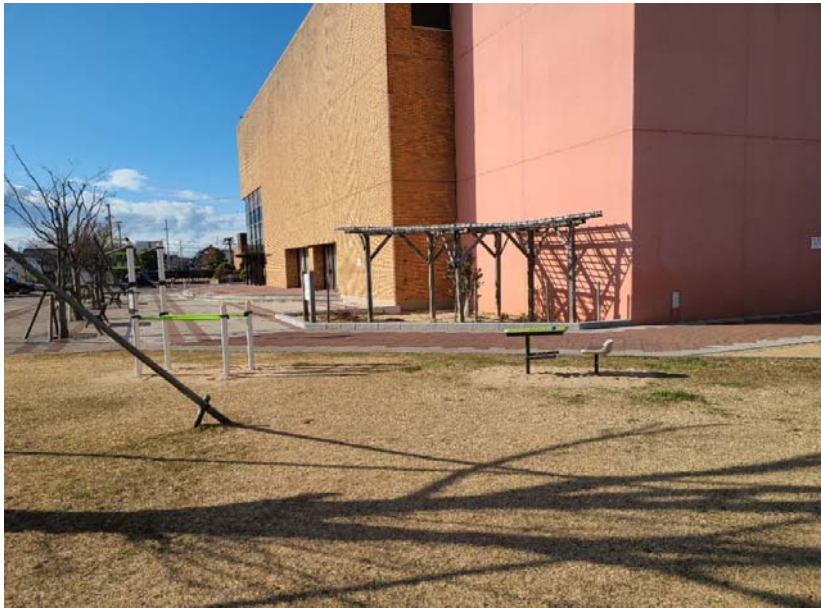
01-5_一色地域文化広場 備考: 健康遊具設置 全景A