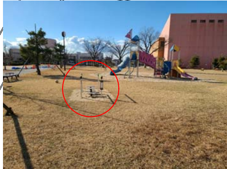
③健康遊具(ステップ) N=1基