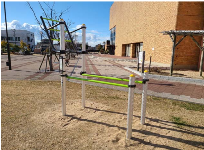
01-6_一色地域文化広場 備考: 健康遊具設置 ①ぶらぶらストレッチ