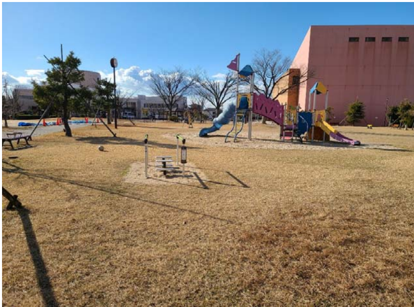
01-8_一色地域文化広場 備考: 健康遊具設置 全景B