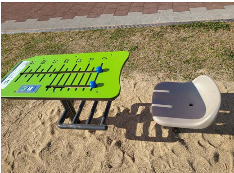
01-7_一色地域文化広場 備考: 健康遊具設置 ②座位体前屈測定