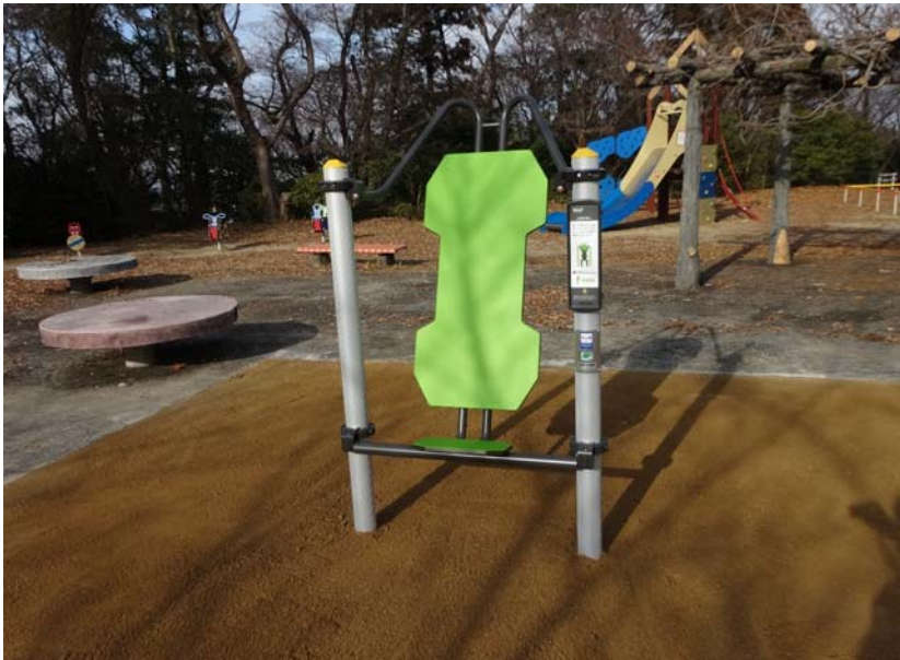
01-2_八ツ面山公園 備考： 健康遊具設置 ①上体のばし