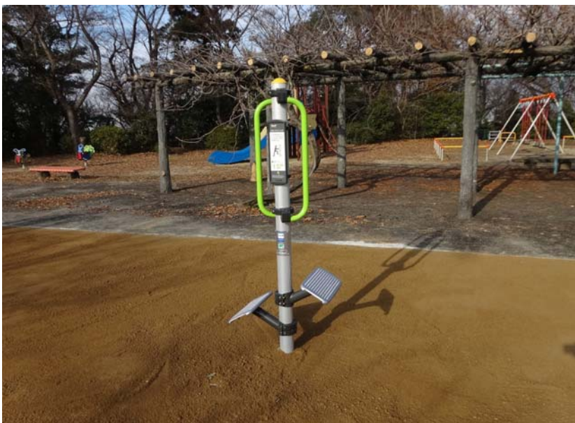
01-3_八ツ面山公園 備考： 健康遊具設置 ②ふみいたストレッチ