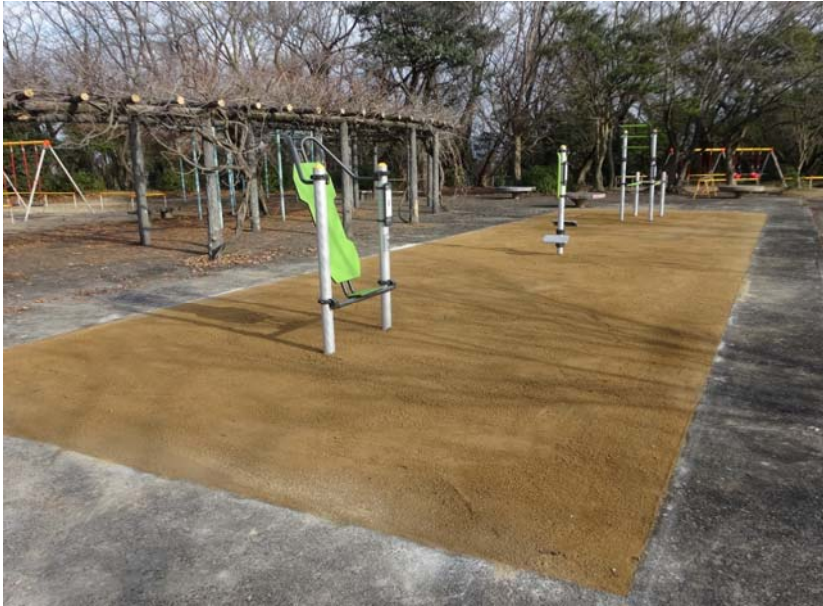
01-1_八ツ面山公園 備考： 健康遊具設置 全景