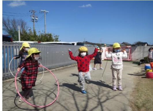
【友達と一緒に運動遊び】