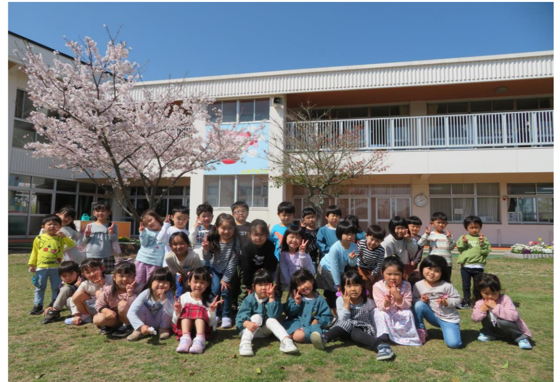
笑顔いっぱい 楽しさいっぱい 荻原っ子！