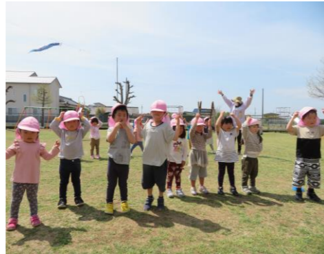
【戸外で体を動かして遊ぶ】