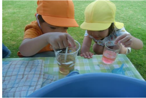
【試しながら色水作り】