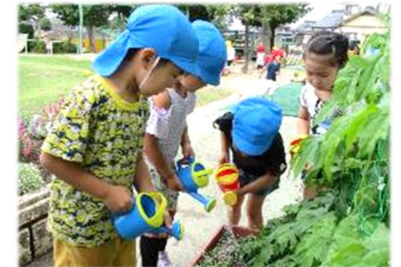
〈年長さんが野菜づくりに挑戦〉

野菜作りをしています。野菜の生長や収穫する喜びを感じ、食べ物を大切にする意識を高めていきます。