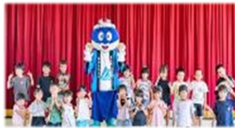
養鰻組合の方との交流