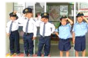
交通安全の呼びかけ