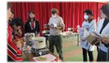
災害時の簡易食事講習会