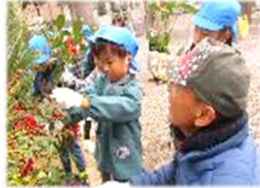
地域の方と門松づくり