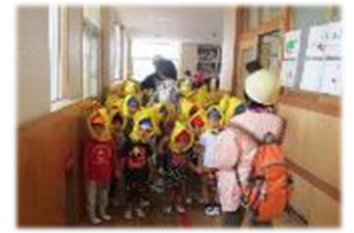
津波避難訓練 小学校3階へ避難