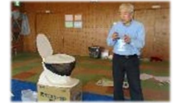
非常時のトイレ講習会