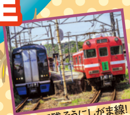
乗って残そうにしがま線!

名鉄蒲郡線 吉良吉田 三河鳥羽 西幡豆 東幡豆 こどもの国 西蒲 形原 三河鹿島 蒲郡競艇場前 蒲郡