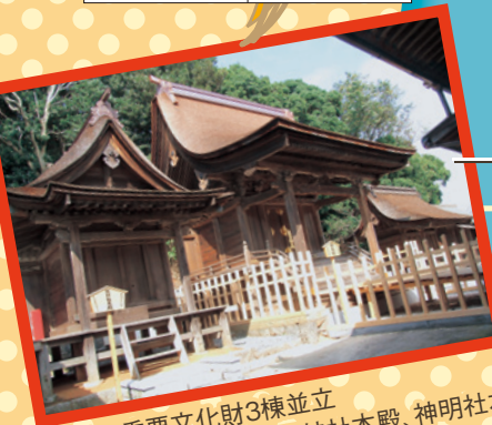
国指定重要文化財3棟並立 左から熊野社本殿、罫頭神社本殿、神明社本殿