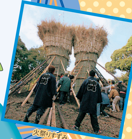
火祭りすずみ 吉良饗庭塩の里