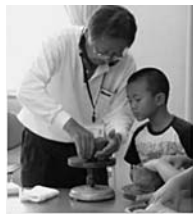
児童クラブで陶芸指導の様子

答 地域の先生に陶芸指導を受け、自分で作った茶碗でお母さんにお茶を飲んでもらったり、イチゴ狩りに畑を提供してくださるなど、大変お世話になっています。今後も大いに活用させていただきたいと思っています。