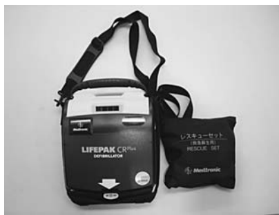
貸出用AED (自動体外式除細動器)

問 災害時のアマチュア無線の電源確保のため、発電機を配置しませんか。 答 発電機を各自主防災会に配置し、より効果的な救援活動ができるように検討します。