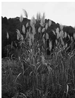
西尾いきものふれあいの里

問 2010年10月COP10（コップテン）が名古屋市中で開催されます。西尾市の取り組みはどのようですか。 答 市として「西尾いきものふれあいの里」を中心とした地域を活用して、会議が成功するように協力します。