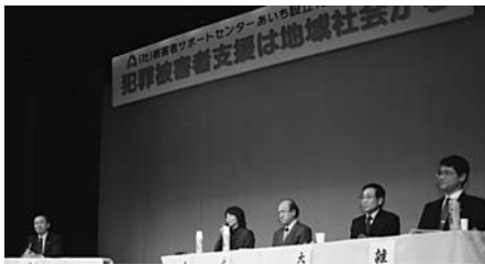
講演会(犯罪被害者支援の会)

問 犯罪被害者が精神的、肉体的、経済的な二次被害に遭わないように支援しませんか。