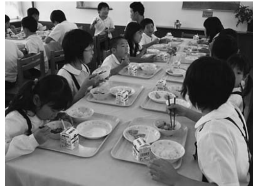
学校給食（ランチルーム）