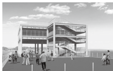
津波避難タワーイメージ図

A 主なハード対策は、令和3年度と4年度に整備する津波避難タワー4か所の施設について、令和2年度は設計業務を行い、令和3年度に整備する2か所の用地購入を行った。