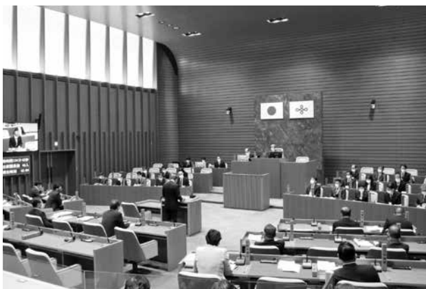
出席議員数を半数にした本会議場の様子