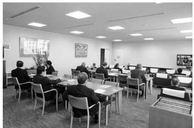
別室にてモニターで傍聴している様子