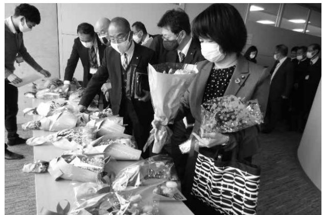
花束を受け取る様子

「花を持って歩こう！」をテーマに花のある暮らしの推進と花の消費拡大を図るために、コロナ禍で消費の落ち込む花き業界を応援する企画に、市議会も協力しました。