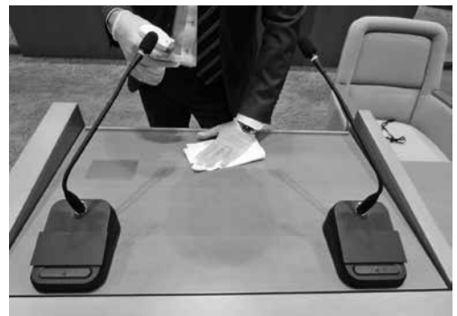
演壇や質問席は、休憩時には毎回消毒しました

西尾市議会では、新型コロナウイルス感染対策として、施政方針演説に対する代表質問や一般質問で、本会議場に参加する議員を半数とし、半数の議員は別室のモニターで傍聴しました。