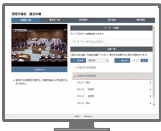
インターネットライブ配信のイメージ画面

子どもたちが目標に向かって、ひたむきに頑張る姿が大好きです。彼らが見据える未来に向かって、チーム西尾も頑張らしましょう!