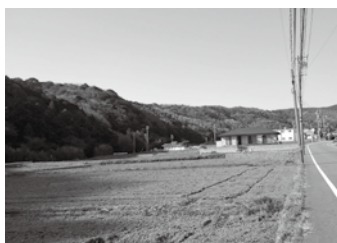
幡豆町小野ヶ谷方面から見る 150畝の県有地

A 本年度、県から市と共に利活用策を検討したいと依頼を受け、職員から提案を募るなど検討を行った。市の意向としてレジャー施設の整備など県へ提案した。その後、関係事業者と意見交換を行ったところ、道路のアクセス性や地区周辺に大勢の利用者が食事できる環境等が整っていない等の理由から商業ベースでの採算性は厳しいとの意見があった。現時点では利活用を検討している状況である。