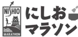
にしおマラソンロゴマーク

A 西尾市初となる「にしおマラソン」は、愛知県初の市民フルマラソンと言われ、令和4年3月6日の開催に向け、実行委員会が中心に準備を進めている。フルマラソンと5キロおよび2キロの部で総参加者9千人を予定。コースについては、西尾警察署と協議を継続中で、同時に関係する町内会に対して、集会等で説明に回っている状況である。ボランティアは2千人〜3千人を想定している。今後、市職員、地元中学校、スポーツ競技団体、地元企業、一般ボランティア等を幅広く募集していく。