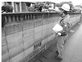
ブロック塀の簡易診断

答 広報で簡易診断はお知らせしているが、自主防災会や町内会にも拡げ、スマートフォンでの情報提供ツールは検討する。