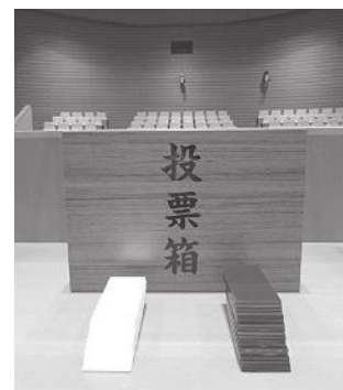
投票で使われた白票と青票

なお、再議(さきの議決の採決)は、地方自治法の規定により、3分の2以上の同意を必要とする特別多数議決の案件となり、議長も採決に加わりました。また、この採決では、白票と青票を使った記名投票となりました。