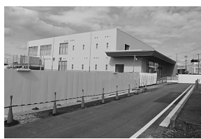
きら市民交流センター(仮称)支所棟

問 きら市民交流センター(仮称)支所棟の生涯学習施設への見直し最終案説明より以前に、SPCと12月に支所棟引渡し、一括買収の協議をしているか。 答 現在SPCと協議中なので答弁は差し控える。