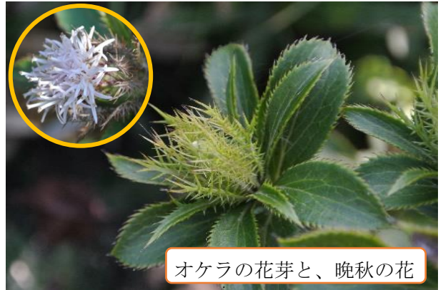
オケラの花芽と、晩秋の花

お盆に毎年行われていた「かぎ万燈」の行事が、台風接近のため中止されました。事前の草刈りは行われ、すでに咲き始めたママコナや、つぼみが出ていたシラヤマギクやツリガネニンジンが刈り取られましたが、地上部が焼かれなかったため、例年より花が早目に見られるかもしれません。また、いつも刈り取られてしまうオケラの花芽が、登山道の脇に残っていました。魚の骨のような総苞の様子を見ることが出来ます。また晩秋には、以前かぎ万燈が中止になって以来5年ぶりに花が見られるでしょう。