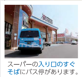
スーパーの入り口のすぐそばにバス停があります。