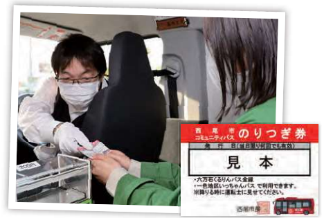
運転手からのりつぎ券を受け取ってください。

いっちゃんバスの運賃は200円。降車時に「 のりつぎ券 」を受け取ることで、当日に限り、いっちゃんバスと六万石くるりんバスに 何度でも乗車できます 。2回目以降の降車時は、のりつぎ券を提示してください。