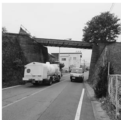
狭小で通行の妨げとなっている旧三河線ガード

問 旧三河線楠駅沿い道路と平東区画整理地区内道路を事故防止や災害時の避難路として活用するため、接続しませんか。