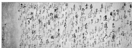
▲後柏原天皇宸翰御消息

介する特別展を開催します。多彩な文化財を通して郷土の先人の歩みや文化、風土をご覧ください。