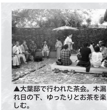
▲大葉邸で行われた茶会。木漏れ日の下、ゆったりとお茶を楽しむ。

伝統的な島の和菓子「かしや餅」を手作りし、アート作品「大葉邸」で抹茶とかしや餅をいただくイベント「かしや餅づくりと大葉邸茶会」が10月9日(日)に行われました。 午前中、弁天サロンで島の女性の指導を受け、約30人の参加者がかしや餅作りに挑戦。子どもも大人も夢中になってあつという間に200個作りました。このかしや餅、餅と言っても小麦粉を練った生地を使います。生地で空豆から作ったあんを包み、さらにそれを島に生息するサルトリイバラの葉で包んで蒸し上げます。昔、島ではかしや餅を農作業の合間の休憩時に食べていたそうです。もちもちとした