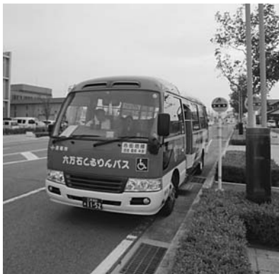
市役所前のくるりんバス停留所