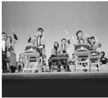
交流活動で頑張る子どもたち