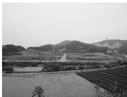
宮迫榎木地区工業団地予定地