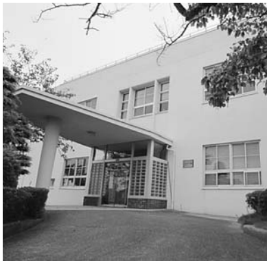
旧吉良町役場本庁舎

問 旧吉良町役場本庁舎は合併後、5か月が経過しましたが、耐震強度不足でありますので、封鎖、立入禁止の状態が続いています。早急に取り壊すべきと思いますが、今後の予定はどのようですか。 答 現在、電算設備及び衛星アンテナを含む防災関連設備などが設置されており、直ちに取り壊すことは、困難です。早急に公共施設対策プロジェクトチームと協議して結論を出します。