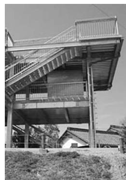
津波避難タワー建設の計画

答 民間の建物も緊急の一時避難先となるよう協力要請をしていきたいと考えています。