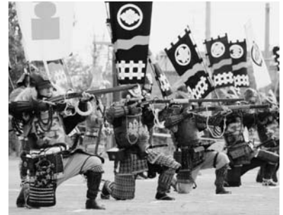
▲昨年行われた火縄銃実演の様子

手づくり甲冑武者隊の行列が、歴史公園から西尾小学校まで練り歩きます。西尾小学校グラウンドでは、西尾藩鉄砲衆が古式火縄銃の実射を行います。 その他 雨天の場合は火縄銃の実演のみ開催します。 問合せ先 文化振興課庶務担当 (☎56・6660/岩瀬文庫内)