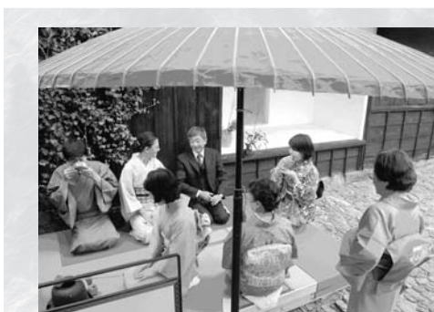
▲昨年の大葉邸茶会の様子

セミの合唱の終わりとともに朝夕はめっきり涼しくなり、秋の訪れを感じるようになりまし。秋は何をするにも心地よい季節です。スポーツの秋や読書の秋もいいですが、「佐久島の秋」はいかがでしょう。 この秋、佐久島では大人も子どもも楽しめるイベントが盛りだくさんです。 10月2日(日)には「歩け歩け海原三里」を行います。これは「にほんの里100選」に選ばれた黒壁の家並みが続く路地を抜け、さわやかな潮風を浴びながら海岸沿いを歩き、