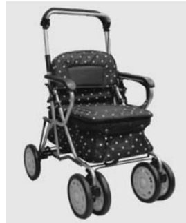
▲シルバーカーの一例

市では、高齢者の歩行を補助するために使うシルバーカー（歩行補助車）の購入費を一部助成します。 対象 一人暮らしの65歳以上で、市民税が非課税の方 助成金額 購入費の2分の1に相当する額で、助成限度額1万円 ※10000円未満は切り捨て。1万円を超えた金額は利用者が負担。 申込に必要な物 購入するシルバーカーの見積書とパンフレット、印鑑 申込・問合先 購入前に必要な物を持参の上、直接長寿課高齢者福祉担当へ。 その他