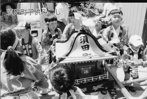
須田町子供みこし