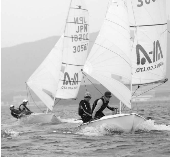
▲世界大会に向け、2艇で練習を行う。刻々と状況が変化する中で風をとらえ、海の上を滑るように走っていく。