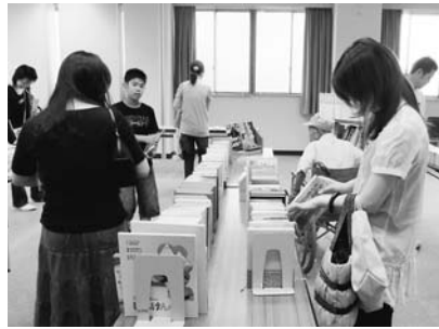
▲本のリサイクル市の様子

①小学生以下のお子さんが参加する場合は、保護者同伴でお越しください。 ②天候などにより中止または内容を変更する場合があります。