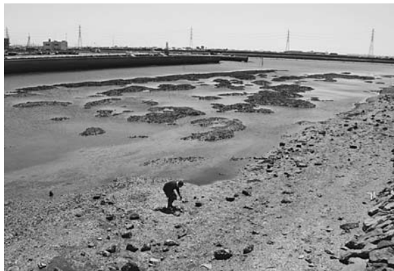
寺津橋から南方の平坂入り江

問 平坂入り江はヘドロが堆積し、入り江に船の航行ができないこともあり改善しませんか。