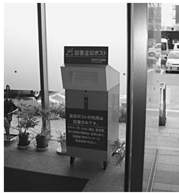
西玄関に移設の図書ポスト

答 図書返却ポストは、24時間いつでも利用できるように、西玄関入り口に配置します。