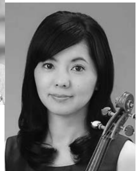
▶崎山弥生 (バイオリニスト)