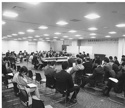
市役所内での「模擬仕分けワークショップ」

答 外部機関へ委託した場合は、約200万円の経費がかかるため、外部機関の利用は考えていません。