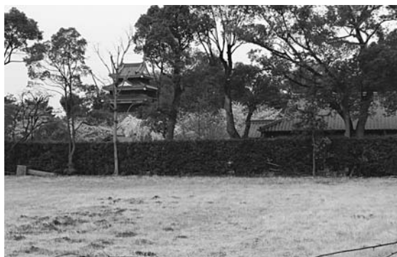
西尾城(二の丸)再建予定地から 本丸丑寅櫓(中央左)、旧近衛邸(右)を臨む

答 西尾は県下でも、有数の歴史、文化財が残っている地域です。遺産や伝統文化を生かした施設・環境を整えます。西尾城は、再建に向け、その面影を