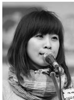
◀ちいぼー (シンガーソングライター)