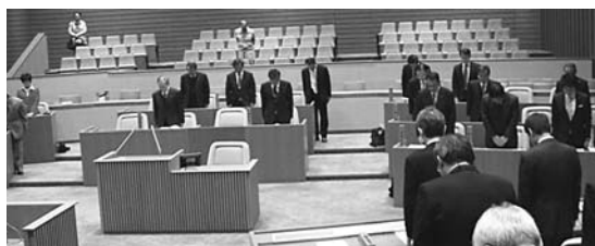
3月22日 本会議場での黙祷の様子

この地震により、被災されました皆さまに謹んでお見舞い申し上げますとともに、西尾市議会議員(24人)全員より、1日も早い復興を願い「義援金50万円」を、全国議会議、日本赤十字社を通じ3月末に被災地に送金しました。