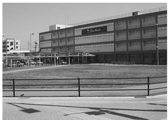
西尾駅西側の芝生広場