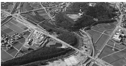
矢作古川河川敷（下）八ツ面山（右上）

答 矢作古川左岸河川敷に、キヤンプ場、複合遊具、芝生広場等レクリエーションゾーンとして整備し、既存の八ツ面山公園との間に橋を架け一体利用できる