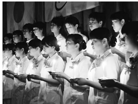
◀看護の道へ進むという自覚を新たに誓った めに行われる看護専門学校の宣誓式

▶ 地域生活支援事業 …手話通訳者などの派遣や住宅用火災警報器の設置、福祉タクシー料金の助成、日常生活用具費の給付など障害者が自立した日常生活ができるよう、幅広い支援を行います。（1億6,943万4千円／福祉課）