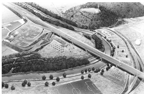
▲「(仮称)親子で楽しめる公園」の完成イメージ