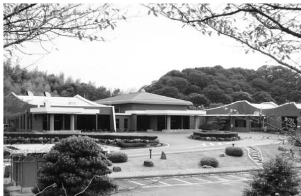
▲吉良町にある西尾市斎場やすらぎ苑