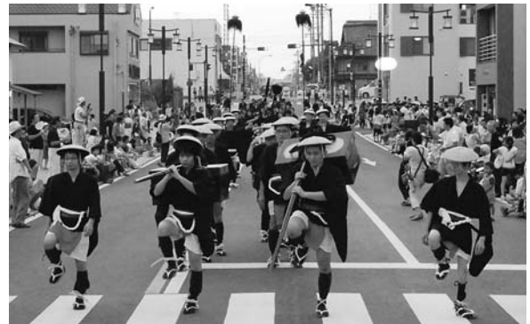
▲西尾まつり(大名行列)の様子。今年度から西尾祇園祭に名称を変更します