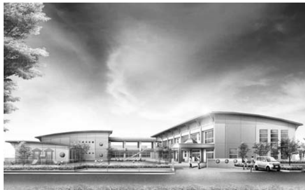
▲(仮称)室場こども園の完成イメージ。真ん中にある渡り廊下を挟んで右側が保育園棟、左側が通園施設棟