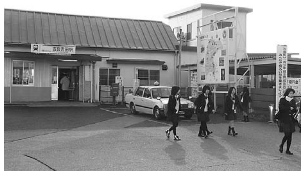
▲自転車駐車場の新設が予定されている名鉄吉良吉田駅