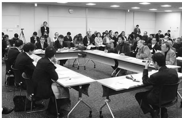
▲昨年度行われた模擬事業仕分けの様子