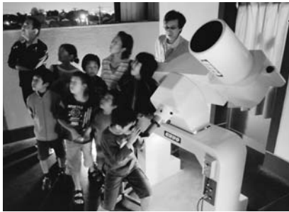
クーデ式屈折望遠鏡で夜空を除く風景