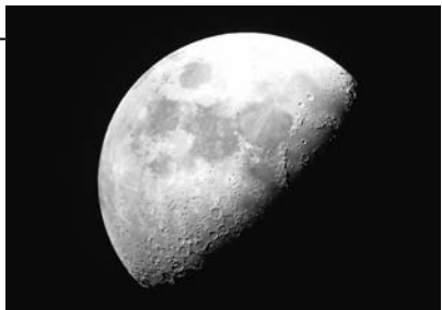
天体望遠鏡を使って撮影された月の写真