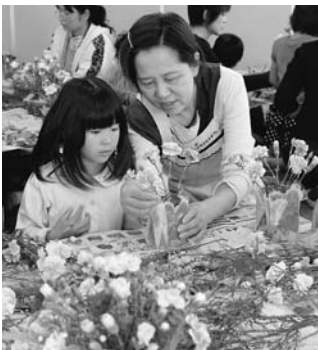
西尾市観光協会では、母の日に「アレンジフラワー作り」を開催します。日ごろの感謝を込めて、カーネーションでつくる世界にたった1つの贈り物をお母さんに贈ってみませんか。